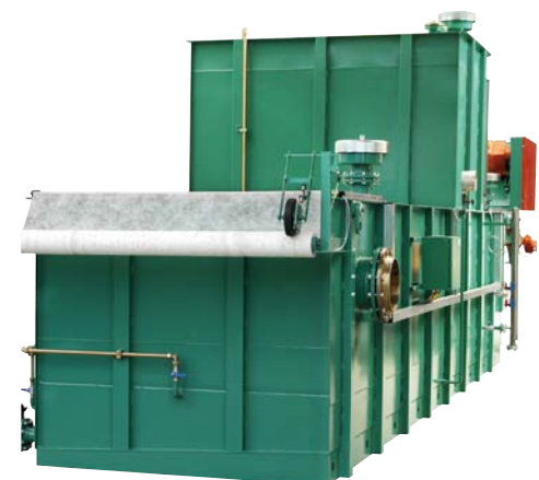
Unterdruck Bandfilter BUF