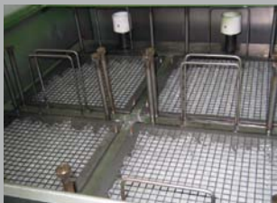
Detailansicht: Blick auf Media-Basket

Das LFOS-System arbeitet nach dem Gesetz der „relativen Durchdringbarkeit unterschiedlicher Flüssigkeiten durch Rückhaltekörper“. Die Rückhaltekörper befinden sich im Media-Basket und sind zeitlich beinahe unbegrenzt haltbar. Bei starker Verschmutzung können die Rückhaltekörper ausgewaschen werden.