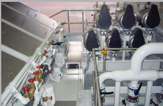
Disc-O-Filter® zur Feinstfiltration auf kombinierter Anlage

Die Anlagen werden so ausgelegt, dass die Bearbeitungsmaschine kontinuierlich mit Kühlschmiermittel versorgt werden kann. Ein Überlauf in den Schmutzbehälter ermöglicht den Kreislaufbetrieb der Anlage. Durch eingebaute Kaskaden / Schikanen oder Förderer wird der Schmutz / Schlamm, der aus dem Liqui Disc-Filtereinsatz entladen wird, zurückgehalten und kann während der Verweildauer abtropfen und abtrocknen. Die Kaskaden, beziehungsweise Schikanen sind en-bloc herausnehmbar. Der Reinigungs- bzw. Entladungsvorgang ist ohne großen Aufwand möglich und kann gegebenenfalls automatisiert werden.