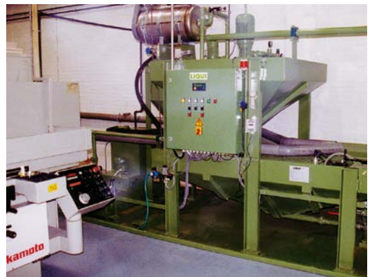
Disc-O-Filter® Typ 250