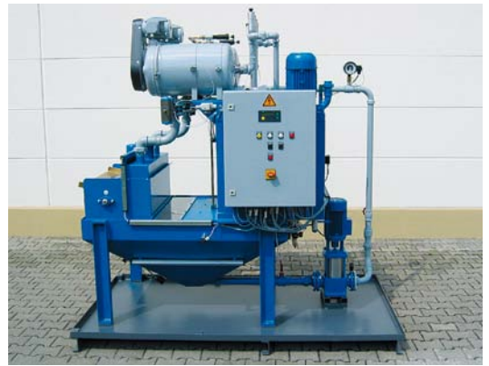
Disc-O-Filter® Typ 250-500