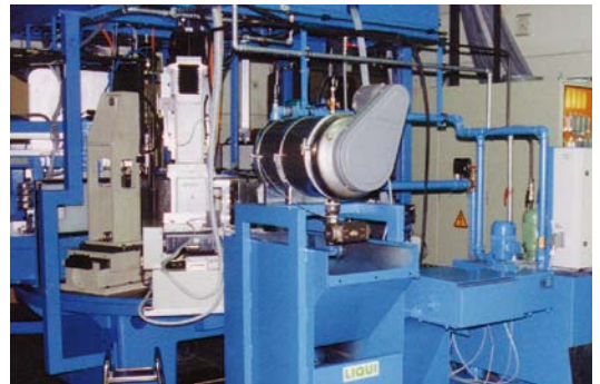
Disc-O-Filter® Typ 100-150